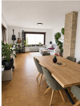
Wohn- und Essbereich vor Renovierung