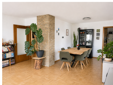
Wohn- und Essbereich vor Renovierung